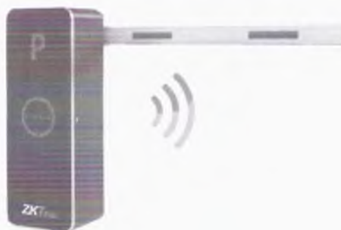
Внешний вид шлагбаума

1. Тип шлагбаума - автоматический шлагбаум ZKTeco BG1060L Wi-Fi с телескопической стрелой 6 метров, левосторонний, с настройкой параметров конфигурации по сети Wi-Fi.