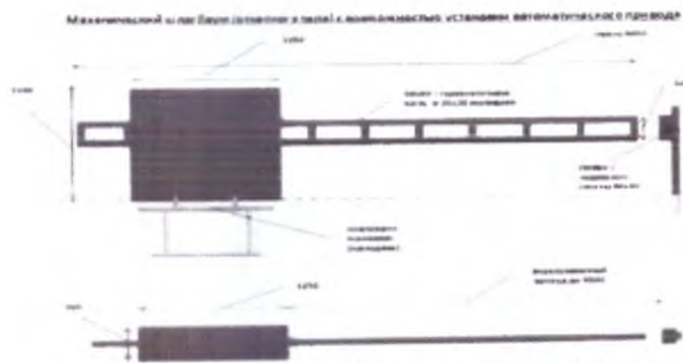
Рис. 4. Внешний вид шлагбаума

Тумба шлагбаума в комплекте с направляющими роликами: размер 1250x500x1250, защитный кожух из стали 1.5мм, имеет окно для обслуживания с запирающим на встроенный замок. Порошковая окраска, стандартный цвет - оранжевый. Приемная стойка: труба 80x40x3, укомплектована довителем для стрелы. Порошковая окраска, стандартный цвет - оранжевый. Закладная для бетонирования на глубину до 500мм. Стрела для проездов до 4800мм: горизонтальные связи - 60x40x2, вертикальные - 40x40x1.5. Порошковая окраска, стандартный цвет - оранжевый.